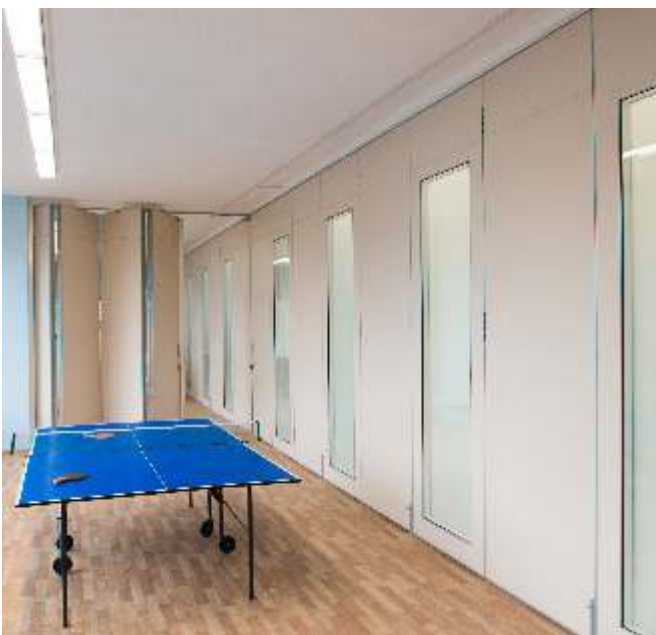
Lasiseinät erityislukion rakennuksessa.