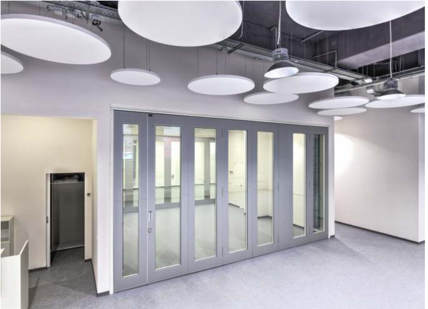
Lasiseinät lääketehaan rakennuksessa.