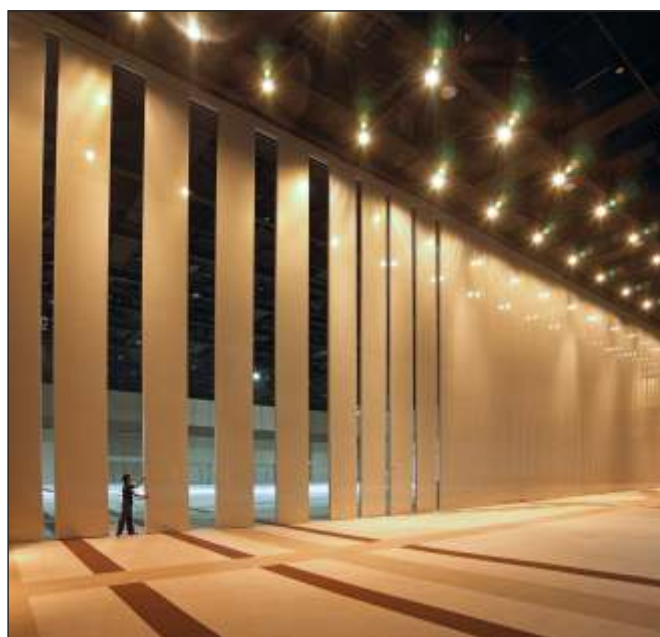
Siam Paragon. Bangkok, Thaimaa