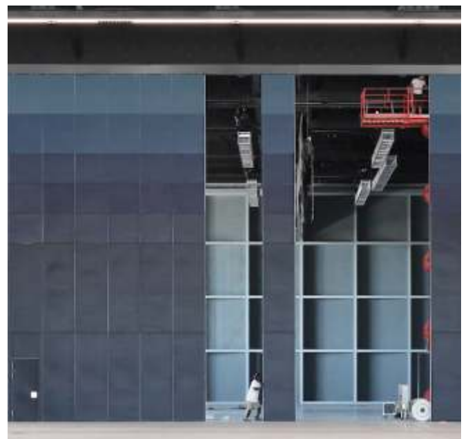
Näyttelypuisto (PEX), Toulouse, Ranska