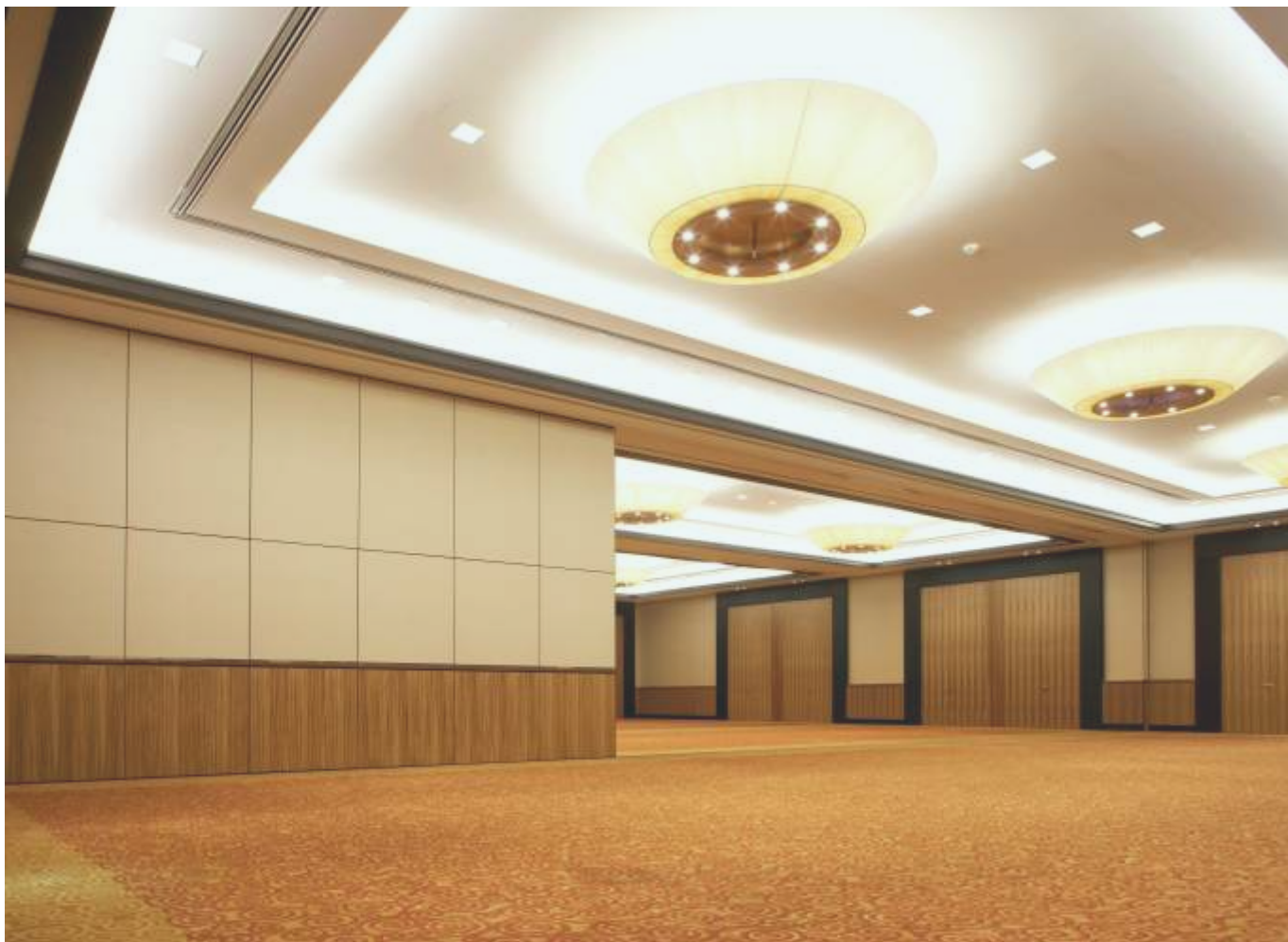
Siirtoseinät puoliautomaattisella käytöllä. Interconti. Düsseldorf