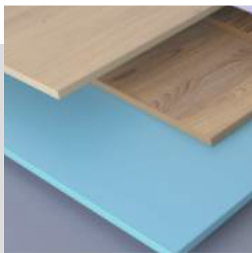
Laminoitu lastulevy Egger

Valitsemme sinulle viimeistelyvaihtoehdon, joka sopii parhaiten sisustukseesi. Teemme työtä maailman parhaiden toimittajien kanssa, niin voimme tarjota sinulle laajan valikoiman korkealaatuisia pinnoitteita.