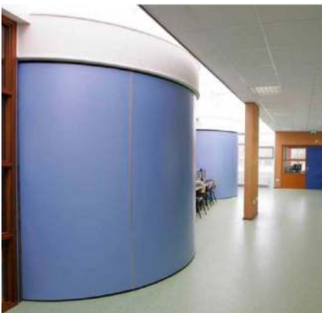
MFC, Reuver, Alankomaat