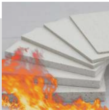
Tulenkestävä pinnoite EI30-60