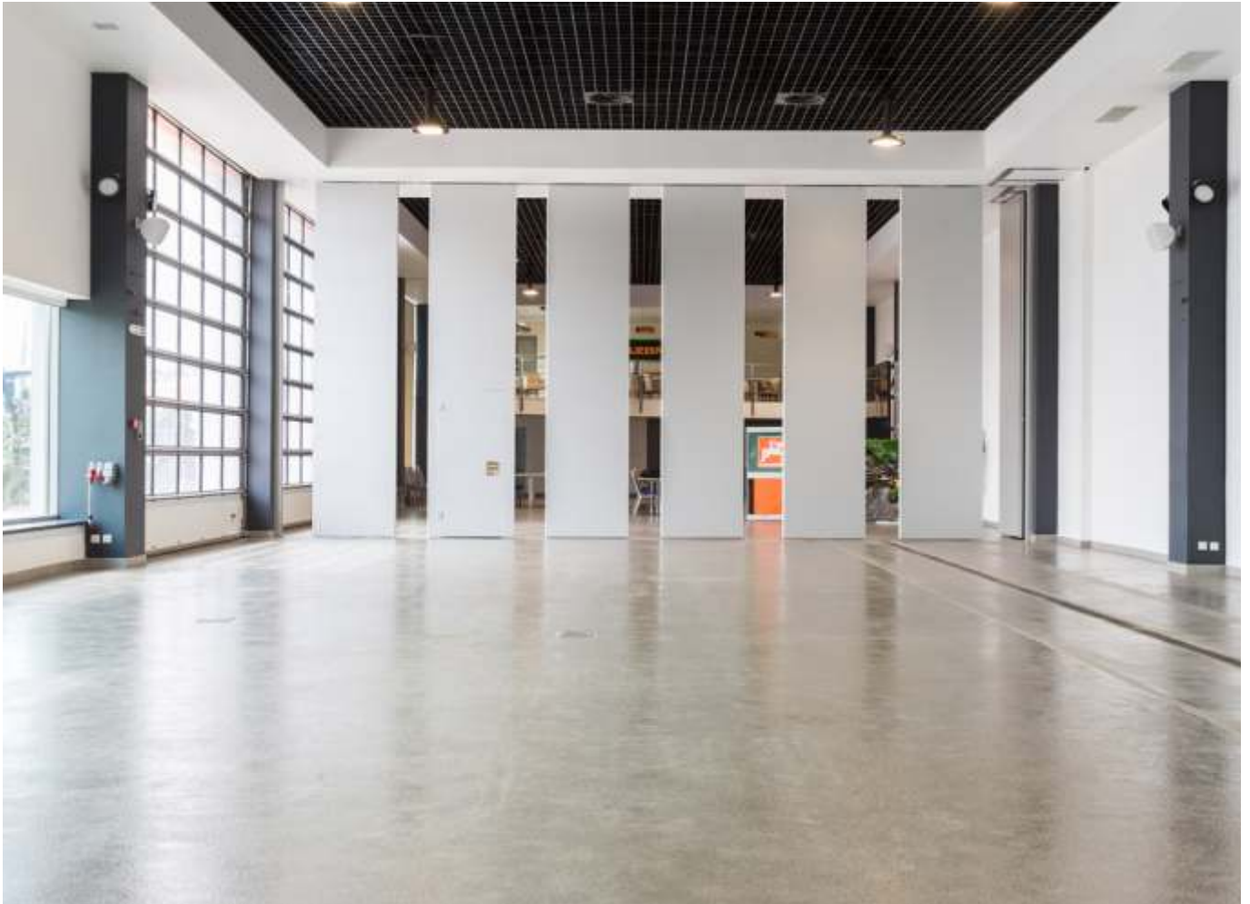
Huipputeknologinen muunneltava konferenssihalli, jossa on siirtoseinät. Eurotechnika-yhtiö