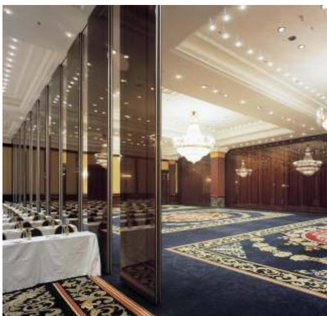
Ritz Carlton. Berliini