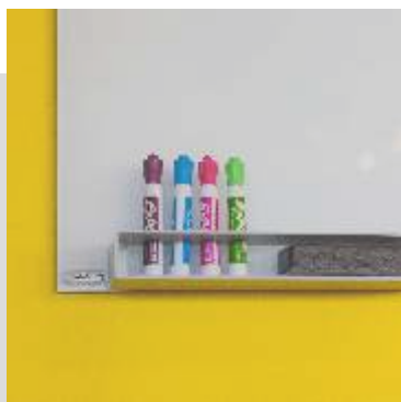
Valkotaulu, magneettitaulu, projektorinäyttö