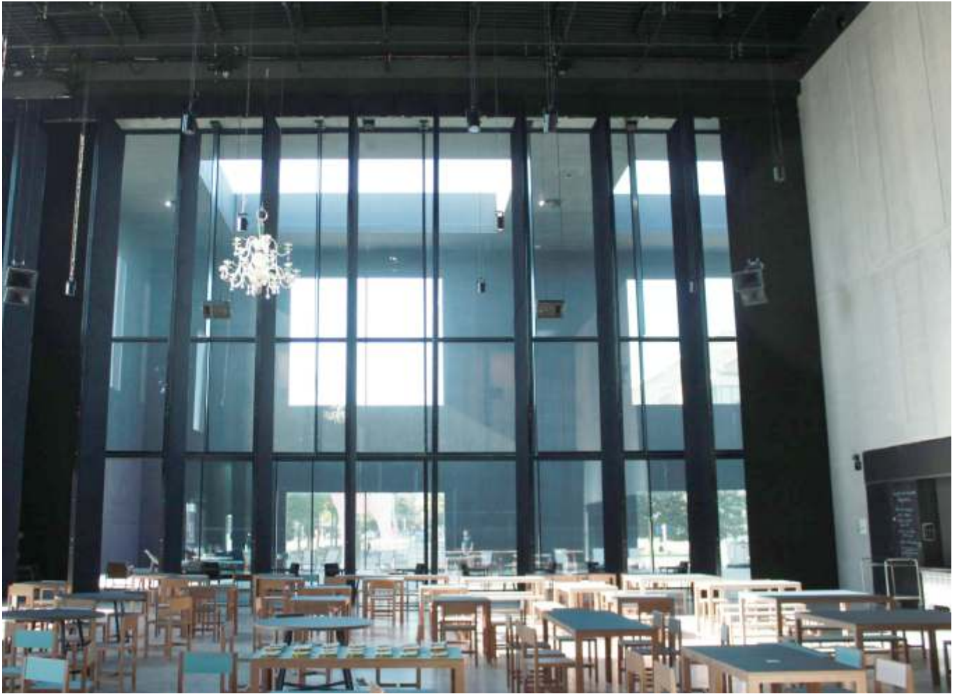
Teatteri Maillon, Strasbourg