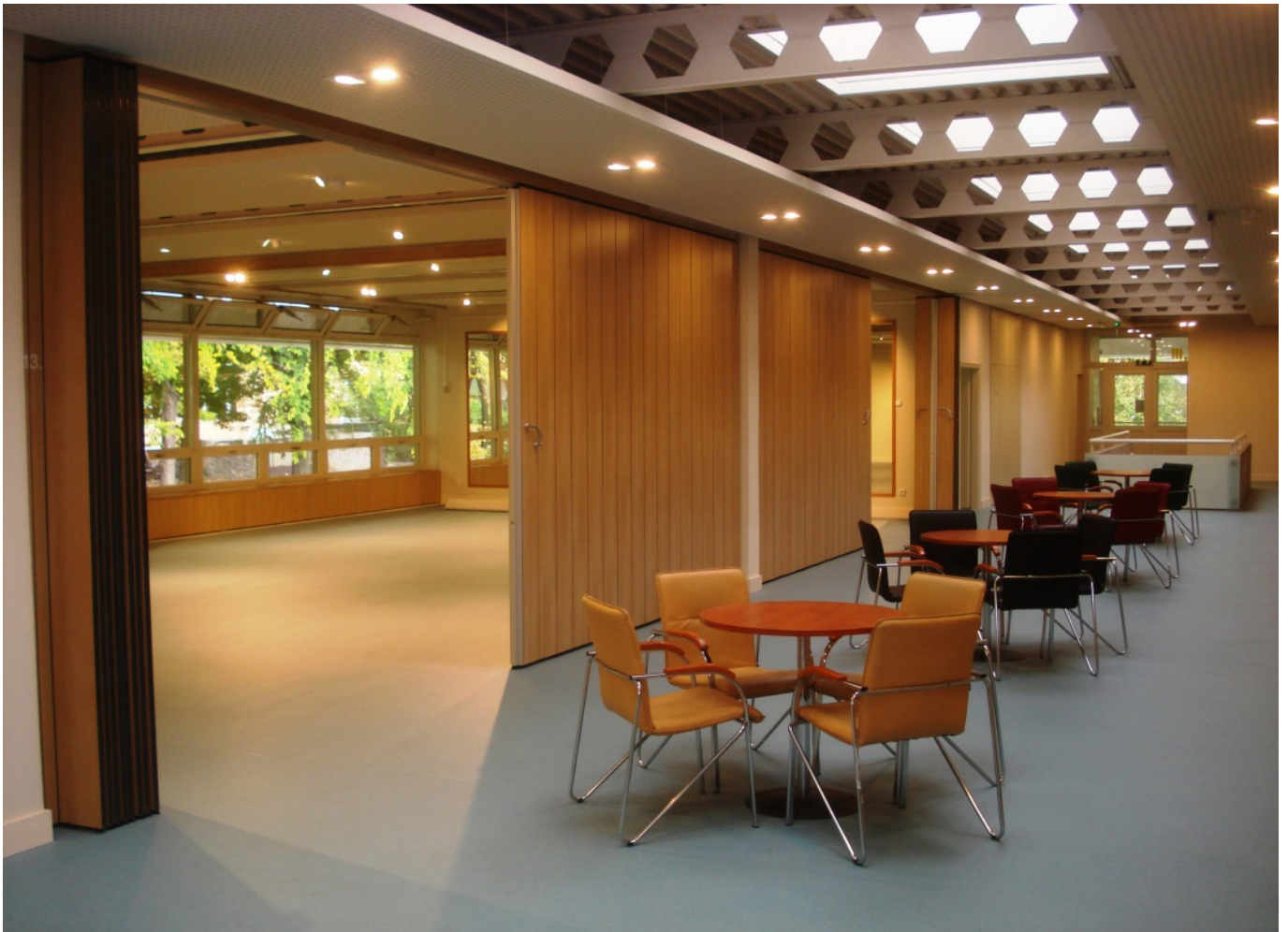
Joustavat väliseinät kahvilassa