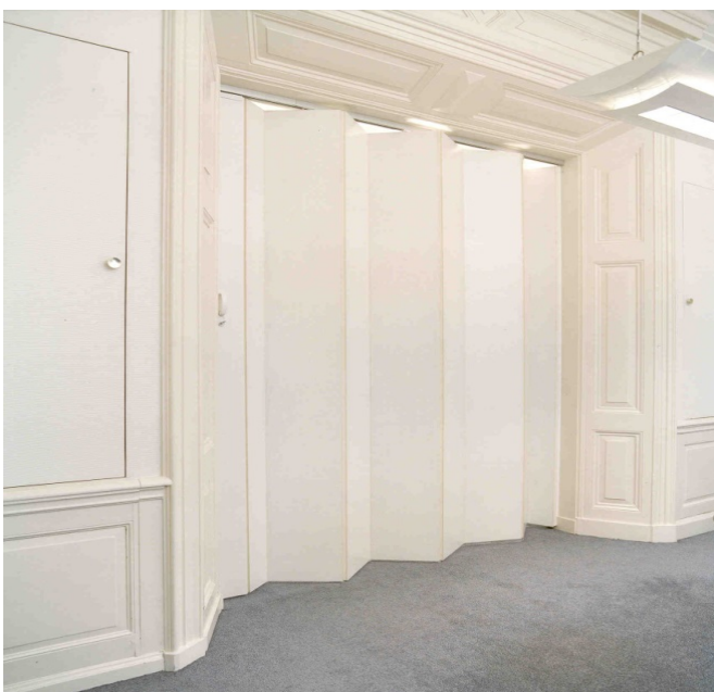
Joustavat väliseinät toimistossa, klassinen sisustus