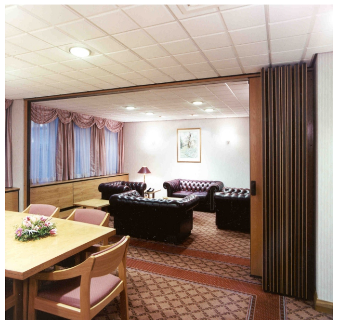
Joustavat väliseinät asunnossa